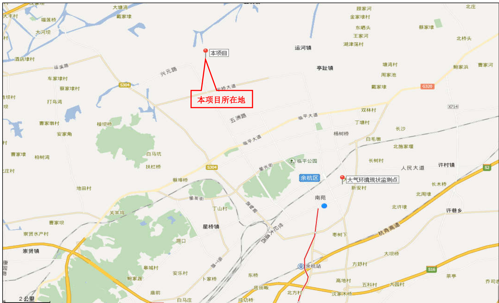
图 3-1 项目地理位置图