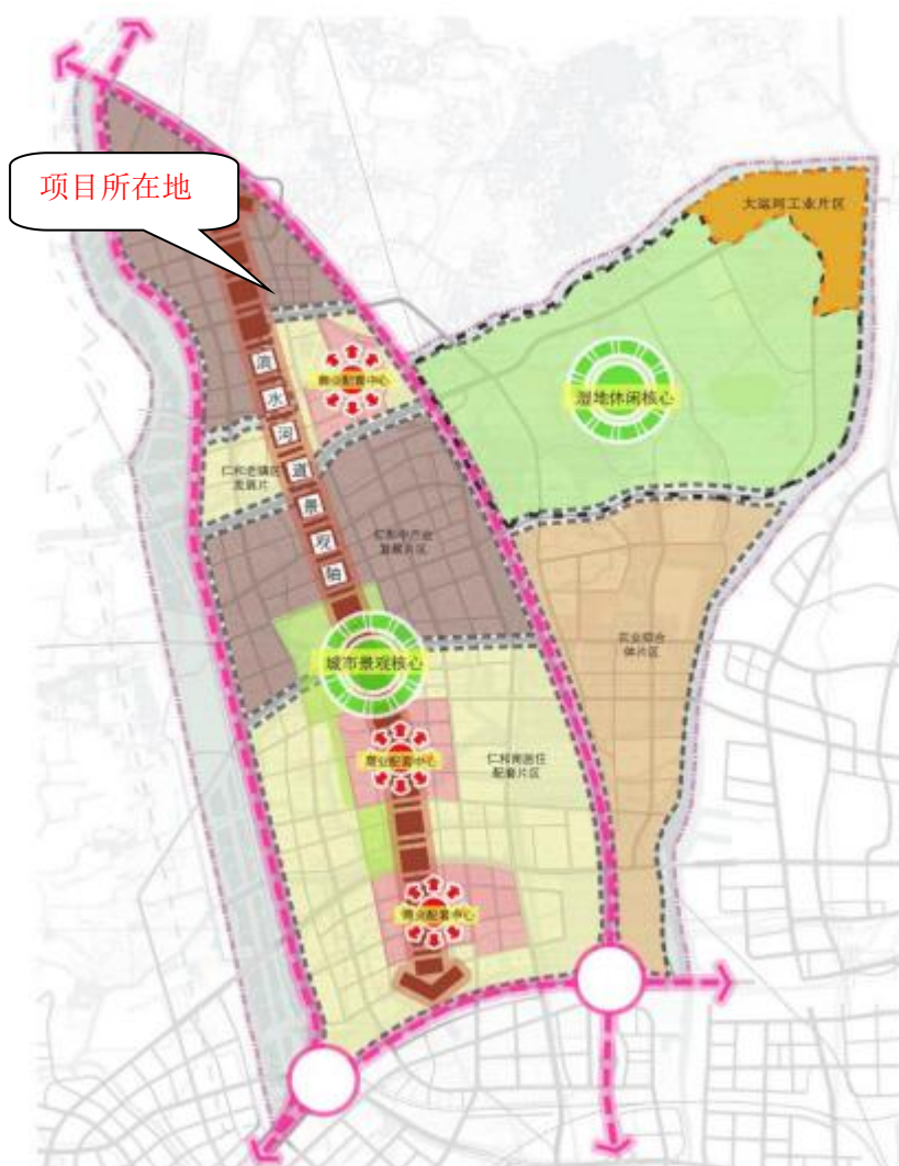
图 2-1 基地总体规划功能分区示意图

仁和先进制造业基地用地呈“一轴两核三心六片”的结构。一轴：滨水河道景观轴，贯穿仁和先进制造业基地，沟通主要功能片区。两核：两个景观核心。一为仁和先进制造业基地景观核心，提供开发区产业生活单元大型集中公园绿地功能；二是以官塘漾、葛墩漾、堰马漾为主要水体的湿地休闲核心，提供仁和先进制造业基地乃至良渚组团湿地公园休憩空间，同时可以适当发展高新农业。三心：三个商业配套中心。分别为 3 个居住组团的商业服务中心。六片：仁和北产业发展片区，仁和老镇区发展片区、仁和中产业发展片区、仁和南居住配套片区、农业综合体片区(包括美丽乡村居住区、高新农业示范区)、大运河工业片区。