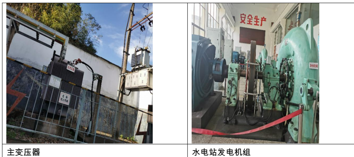
图 3.5-1 水电站构筑物