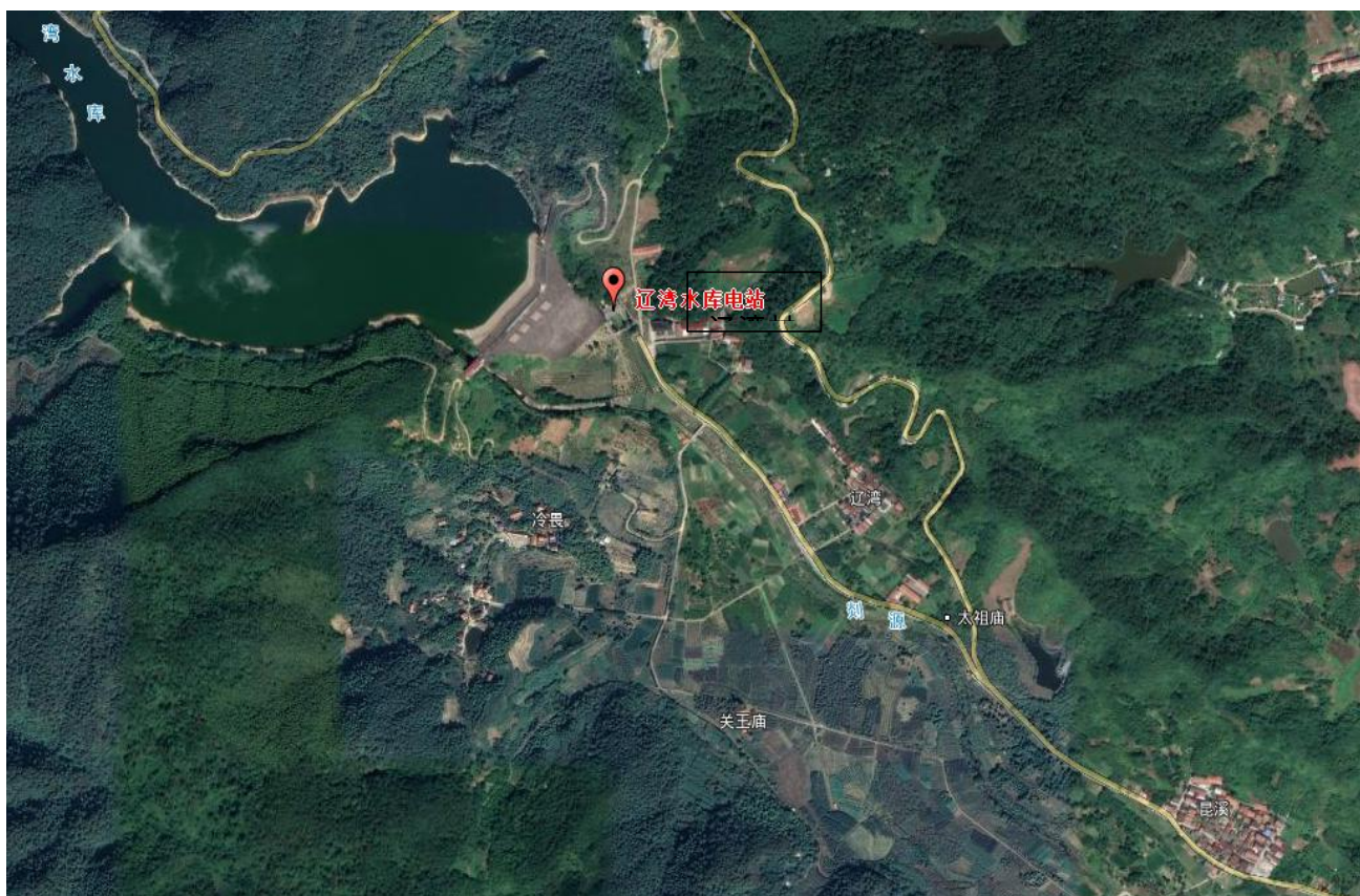
图 2.5-1 环境保护目标