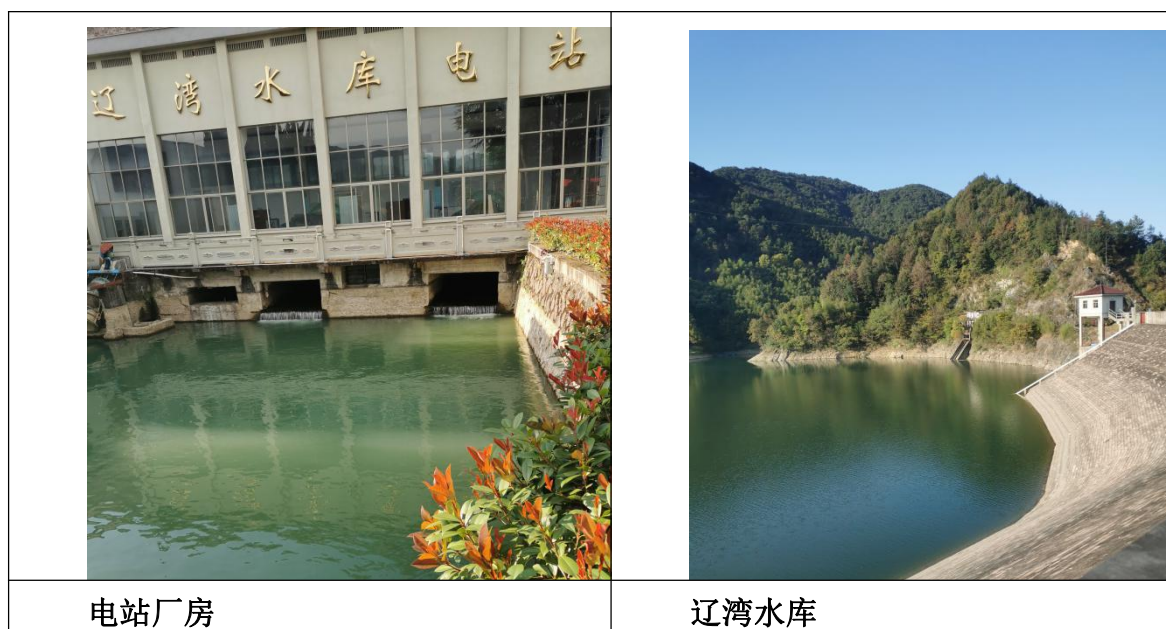
图 4.3-3 土地利用现状图