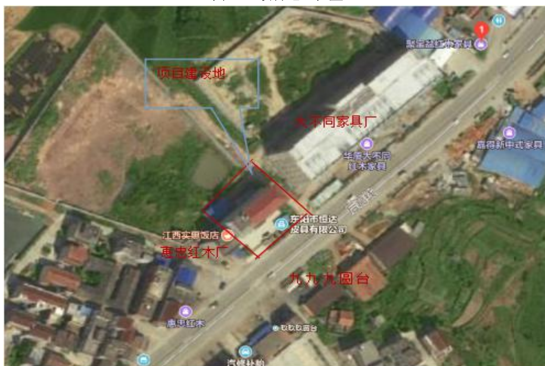
图 2-1 项目地理位置