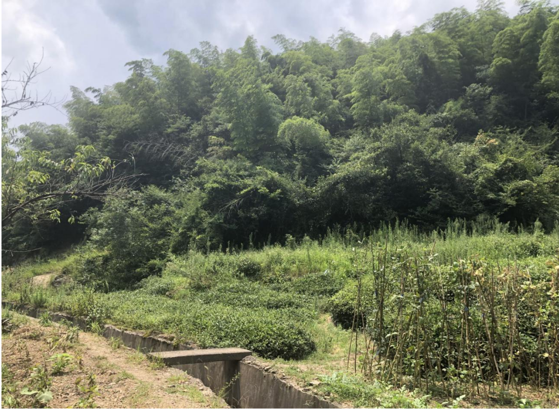
图 1-1 原有工程弃渣场

现场调查结果显示，该电站无弃石、弃土遗留问题，坝址、渠道、发电厂房等处因电站建设造成的植被破坏已经完成自然恢复，目前植被恢复情况良好，无裸露空地、边坡存在，恢复以自然恢复为主，恢复植被为灌丛及灌草丛，电站建设期间造成的生态环境影响已经基本消除，区域环境现状良好。