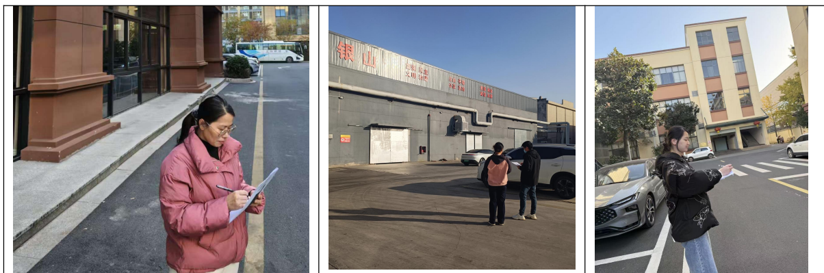
图 9-1 开展公众意见调查工作

本次验收公示期间未收到企业或个人的反馈意见；公众调查期间，总共发放附近居住点和附近企业和个人调查表 12 份；根据调查结果，项目试运行期间，未发生过环境污染事故；12 个被调查对象对本项目的环境保护工作表示满意，无不满意意见。